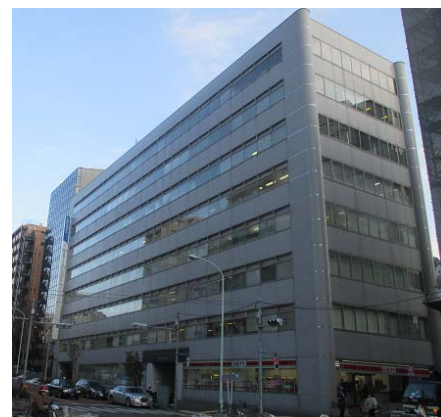
新宿6丁目ビル外観