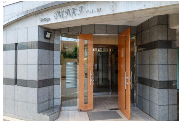
対象物件エントランス