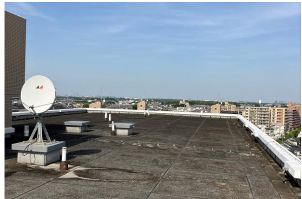
太陽光パネル設置予定の屋上