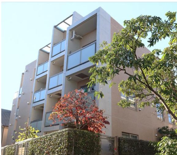
ベルアルシェ東高円寺

これらの取り組みを通じて、物件価値の向上を図るとともに、運用終了(全物件の売却完了)までの期間の最短化を図り、投資家の皆さまの出資金の投資効率向上を目指します。