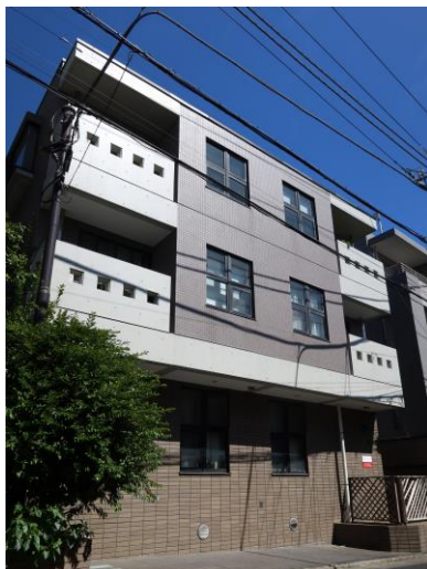
対象のマンション

2023年10月末日現在、10戸中9戸が賃貸中となっており、残り1戸についてはリーシング活動を行い、早期の満室稼働を目指します。また、各住戸における契約更新のタイミングで適正賃料への引き上げを行い、キャッシュフローの向上に努めます。賃貸借契約が終了し入居者が退去した場合は、必要に応じて適宜リニューアル工事を施し不動産価値の向上に努めます。これらの取り組みを通じて、本物件の不動産価値の最大化に努め、好機を見定めて不動産市場にて本物件を売却し、売却益を分配することを予定しています。