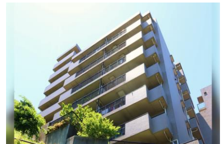
対象のマンション (8戸を組み入れ)