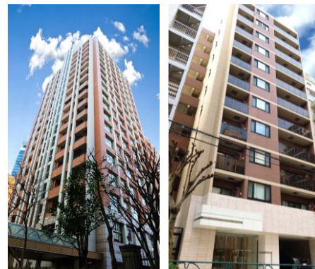
対象のマンション (各1戸を組み入れ)