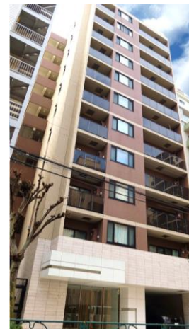
対象のマンション (各1戸を組み入れ)