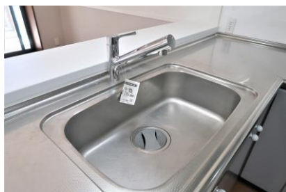
節水仕様のキッチン水栓