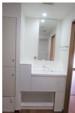
ペットフレンドリーな独立洗面台