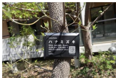
樹種が分かるQRコード