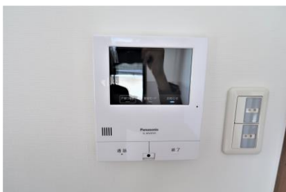
カメラ付きインターホン