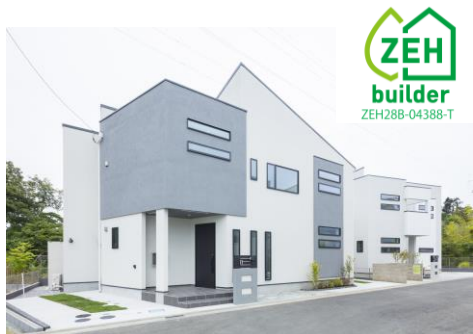
THEパームスコート鎌倉城廻

トーセイとアーバンホーム合同で施工、販売を行っている「THEパームスコート鎌倉城廻」で、アーバンホームがトーセイグループ初となるネットゼロエネルギーハウスを建築しました。「創エネ」「断熱」「省エネ」という3つのポイントにおいて高性能な設備・仕様を多数採用しています。