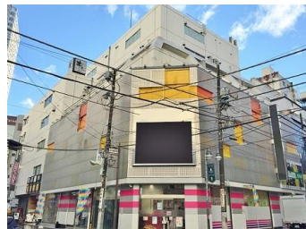
K社: 池袋所在物件を中心に7物件取得