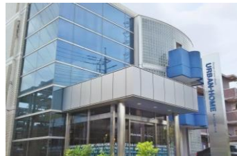
戸建分譲会社 (株)アーバンホーム

2015年12月 戸建分譲会社2社 (株アーバンホーム・(株)アーバンネクスト) 戸建分譲・請負・仲介等を手がける2社を 取得し、仕入・販売網を拡大