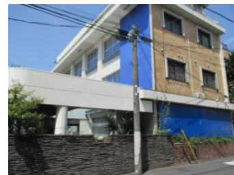
F社: 中野駅南口所在の6物件