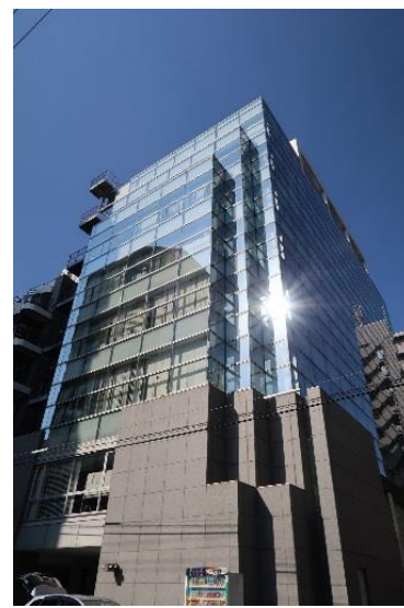
組み入れ対象物件(外観)