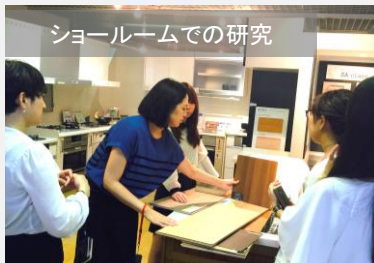
ショールームでの研究