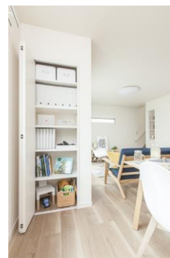
<リビング収納・洗面収納>

家で快適に過ごすためには、散らからない工夫が必要です。そこで、“Irodorie”では玄関、廊下、リビング・ダイニング、キッチン、洗面室、階段など至る所に使い勝手の良い収納スペースを設けています。