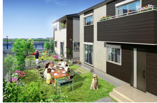
※図面をもとに描き起こしたもので、実際とは多少異なります。

トーセイでは、今後も土地の個性やライフスタイルに合った住まいの在り方を考え、トーセイならではの住まいを提案してまいります。