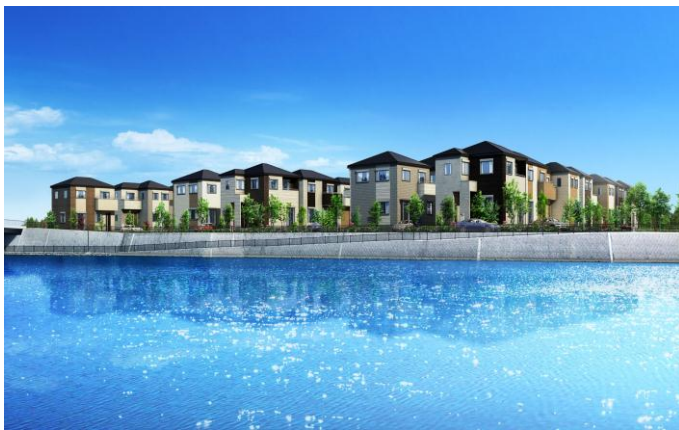
※図面をもとに描き起こしたもので、実際とは多少異なります。

『THEパームスコート越谷レイクタウン』は、JR武蔵野線「越谷レイクタウン」駅から徒歩13分に所在する、全68棟の戸建住宅です。越谷レイクタウンは、平成20年に街開きのニュータウンで、住環境としての魅力が溢れる街です。誰もが安心して住み続けることができるよう街全体にバリアフリーが採用されているほか、日本最大級のスケールを誇るショッピングモール“イオンレイクタウン”があり、グルメやアミューズメント、アウトレットが揃うなど、生活利便性にも優れています。また、地区中央に造られた約40haの“大相模調節池”のほとりには水鳥や魚、昆虫が生息するビオトープが広がり、「環境との共生」が図られています。