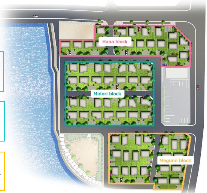
※図面をもとに描き起こしたもので、実際とは多少異なります。

Megumi block …テーマは「エディブル」 人だけでなく野鳥も食べられる果樹を豊富に植え込み、自然と共存する空間を創出。