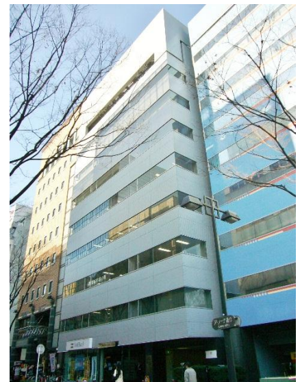
組み入れ対象物件(外観)