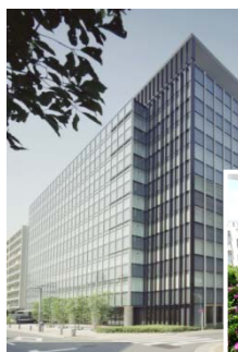
蒲田トーセイビル