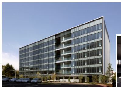
平和島トーセイビル