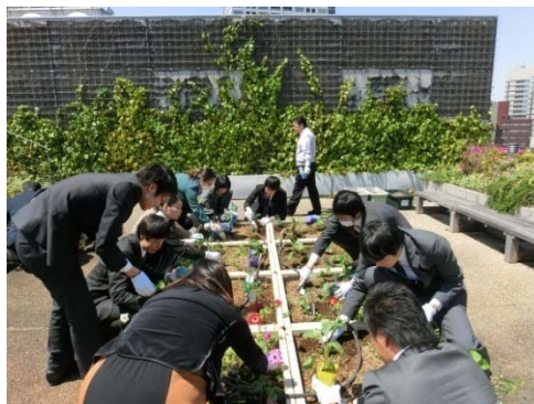
本社ビル屋上菜園