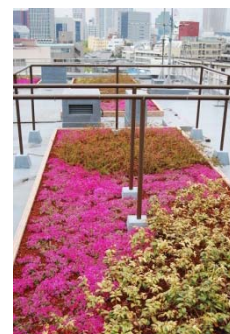
既存ビル屋上緑化