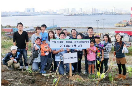
東京都海の森 植樹活動