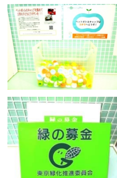
社内の環境貢献活動