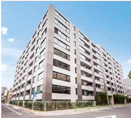
【THEパームス月島ルナガーデン外観】

トーセイでは引き続き堅調に推移する住宅市場に鑑み分譲マンション・戸建住宅の開発・販売を推進しています。エリア特性に応じた多彩なラインナップを誇る分譲マンション“THEパームス”シリーズは、現在、中央区小伝馬町など都心エリアを中心に3棟販売しており、販売は順調に進捗しています。