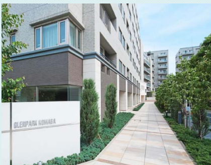
【進化型リスタイリング】 グレンパーク駒場(世田谷区池尻4丁目)