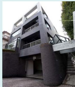
【リスタイリングの継続】 代々木上原マンション(渋谷区上原3丁目)