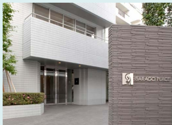
【リスタイリングの継続】 伊皿子ブレース(港区三田)