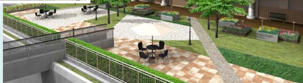
【リスタイリングの継続】 ルネ東寺尾(横浜市鶴見区)