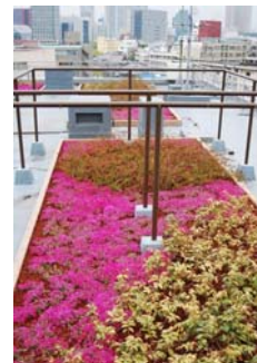
既存ビル屋上緑化