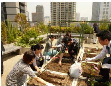
本社ビル屋上菜園