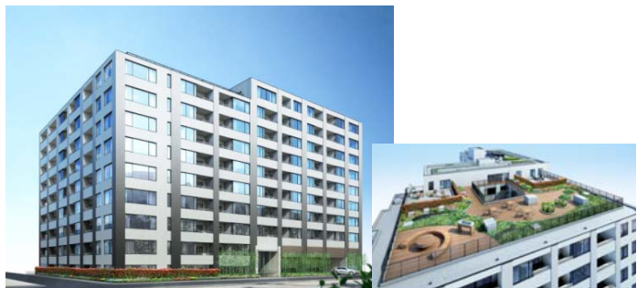
電カー一括購入・太陽光発電システムや屋上菜園を導入