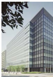
蒲田トーセイビル