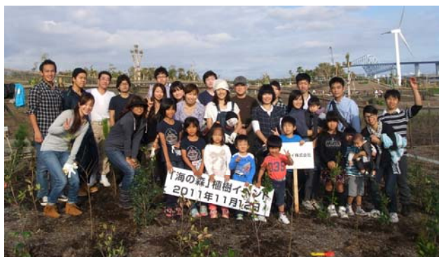
東京都海の森 植樹活動