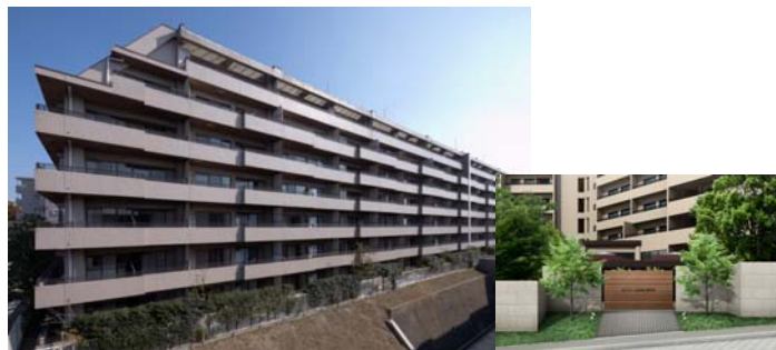
Restyling初、カーシェアリング・レンタサイクルを導入