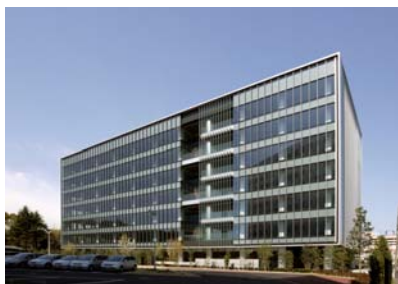
平和島トーセイビル